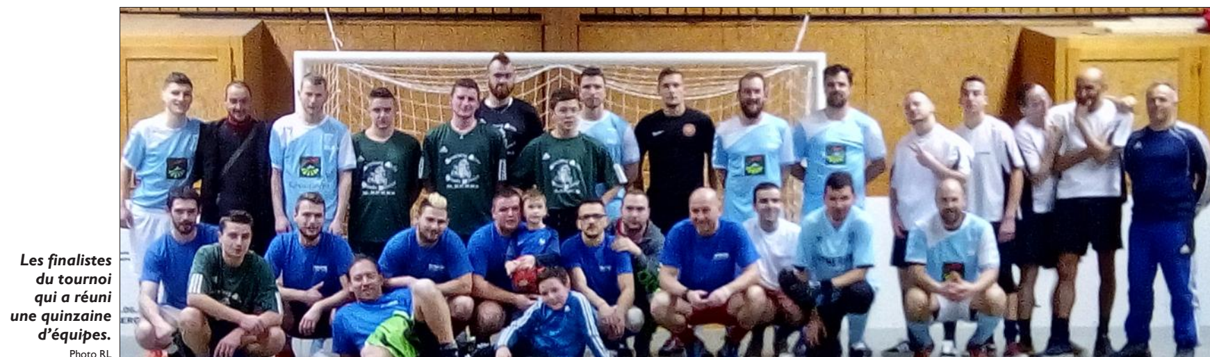
Les finalistes du tournoi qui a réuni une quinzaine d'équipes.

Samedi, 15 équipes de différentes entreprises ont participé au tournoi en salle au gymnase du complexe culturel. Dans la