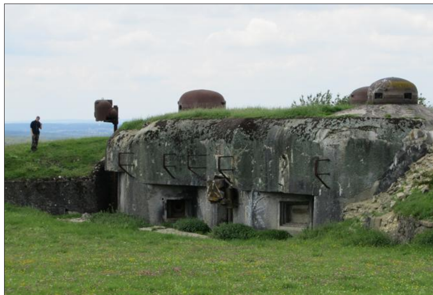
Le fort a été érigé à 336 m d'altitude, le point culminant du ban d'Achen.