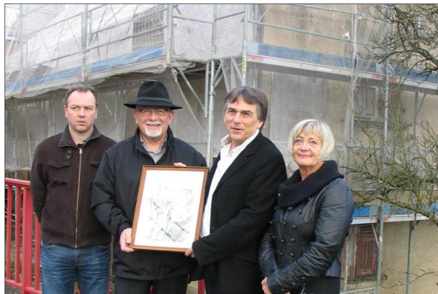
Les travaux de restauration de la maison Stern ont démarré.

Le maire Laurent Schrub a précisé que toutes les idées et actions pour faire aboutir ce projet de sauvegarde retiendront l'attention de la municipalité.