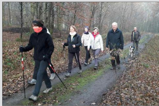
L'Amicale des sapeurs-pompiers de Walschbronn organise une marche le dimanche 26 février.

L'Amicale des sapeurs-pompiers de Walschbronn organise une marche le dimanche 26 février. Le rendez-vous des participants est fixé à 10 h 15 au terrain tennis et le départ aura lieu à 10 h 30. Inscription avant le 19 février au 06 47 33 96 45 ou 03 87 96 55 95 ou 07 71 10 55 95. A l'issue de la marche sera servi un repas au prix de 7 € (soupe de petits pois). Grillades et café gâteaux seront également disponibles.